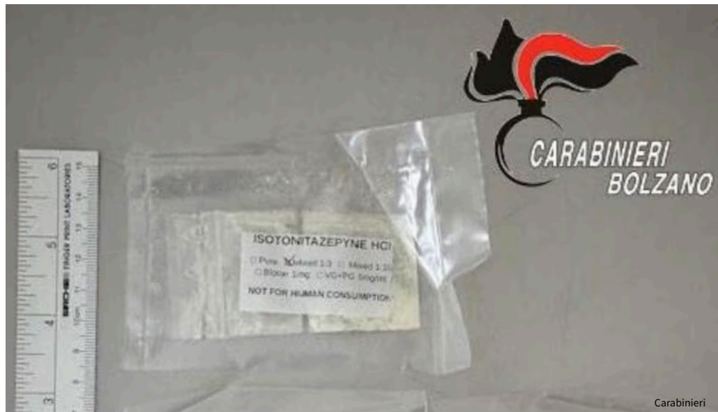
nitazeni, droga sintetica

I nitazeni costituiscono una famiglia di oppioidi sintetici estremamente potenti: sviluppati in laboratorio, imitano gli effetti degli oppiacei derivati dal papavero ma con potenza e rischi molto superiori. La loro rilevazione è spesso difficile con i test tossicologici standard, un elemento che complica diagnosi e interventi medici.